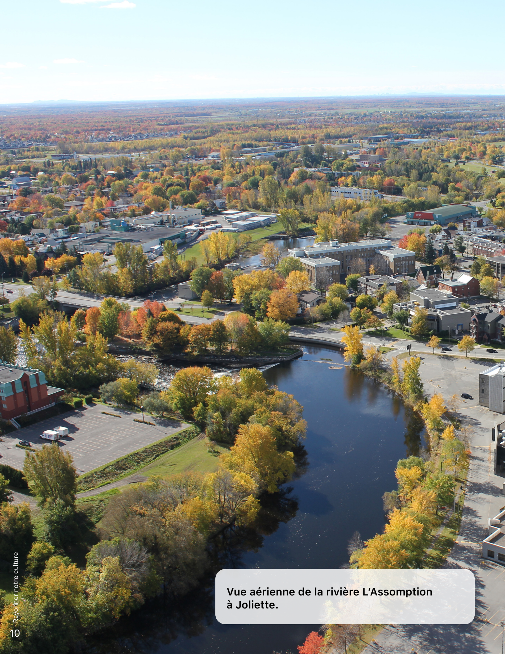
Vue aérienne de la rivière L'Assomption à Joliette.