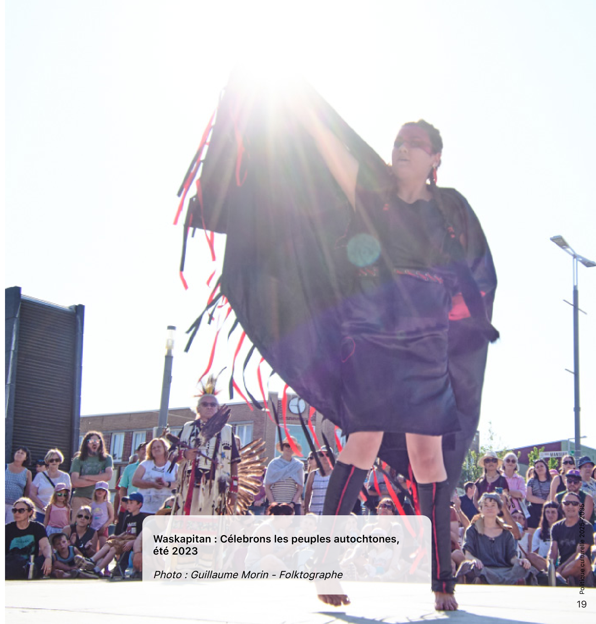
Waskapitan : Célébrons les peuples autochtones, été 2023