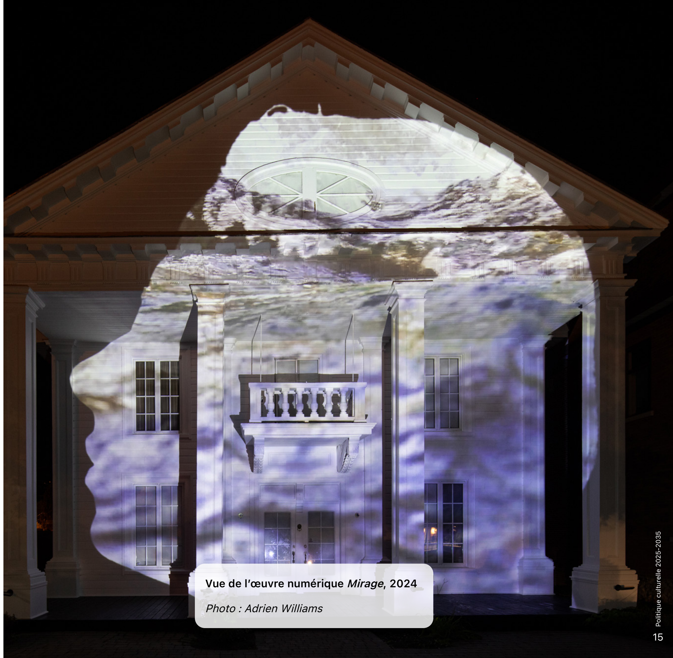
Vue de l'œuvre numérique Mirage , 2024

Faire de Joliette un pôle culturel incontournable au Québec. Une ville où la culture est profondément ancrée dans la vie des citoyennes et citoyens, où son rôle transcende le domaine culturel pour s'inscrire dans une dynamique de cohésion sociale et de progrès économique, au bénéfice de l'ensemble de la communauté. Se distinguer à l'échelle provinciale grâce à des initiatives culturelles audacieuses, fruits de collaborations étroites entre les partenaires locaux.