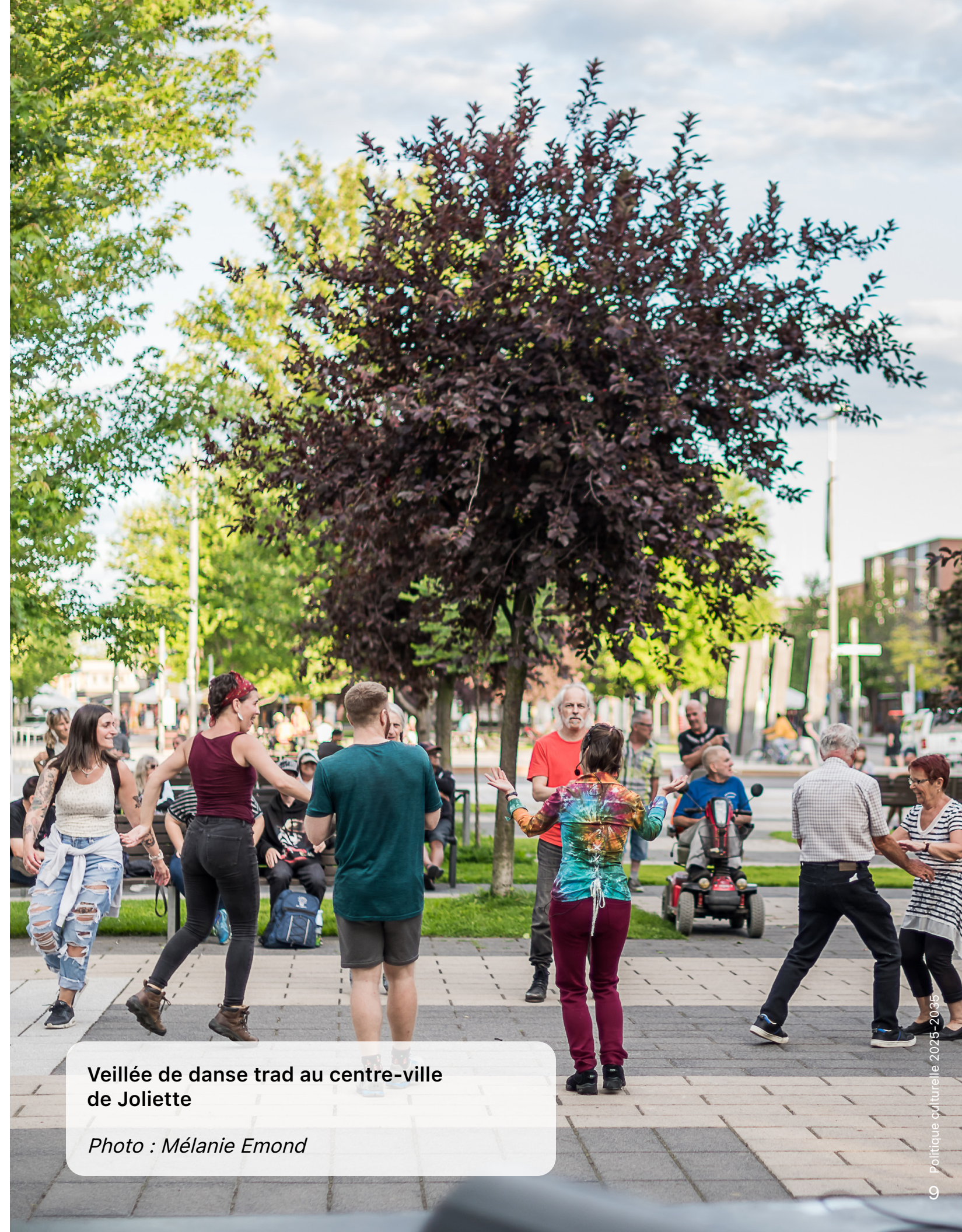
Veillée de danse trad au centre-ville de Joliette