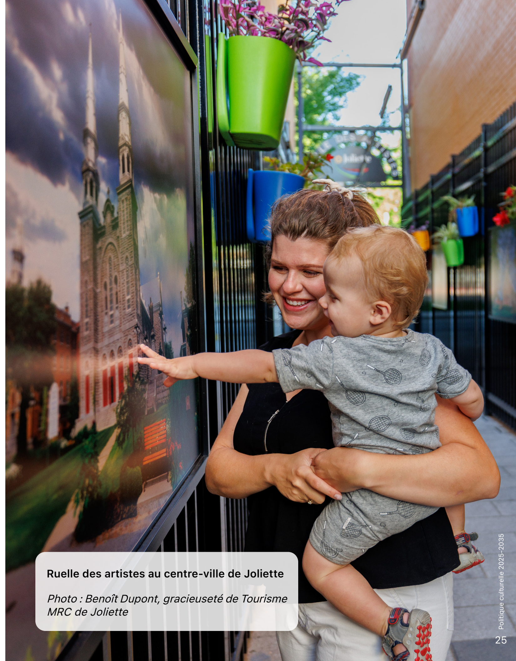
Ruelle des artistes au centre-ville de Joliette